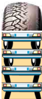
Důsledky špatné geometrie.